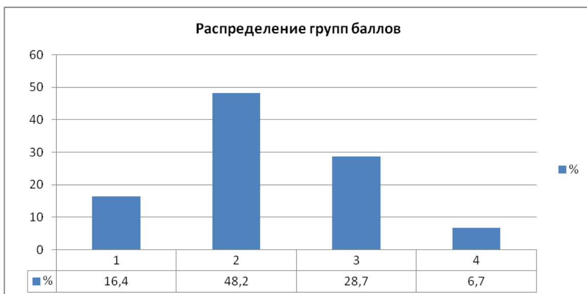
Рис. 1. Распределение участников ЕГЭ по биологии по четырем группам в 2017 г.

Как видно из диаграммы, большинство экзаменуемых продемонстрировали средние результаты по биологии и вошли в группы с удовлетворительным и хорошим уровнем подготовки, соответственно 48,2% и 28,7%. Результаты этих групп вполне соотносятся с результатами, полученными в 2016 г. (49,2% и 26,6% соответственно).